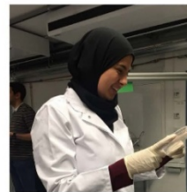
Ouafa deed onderzoek op het gebied van Biofabrication in Würzburg

Meer informatie: www.studereninduitsland.nl/beurzen